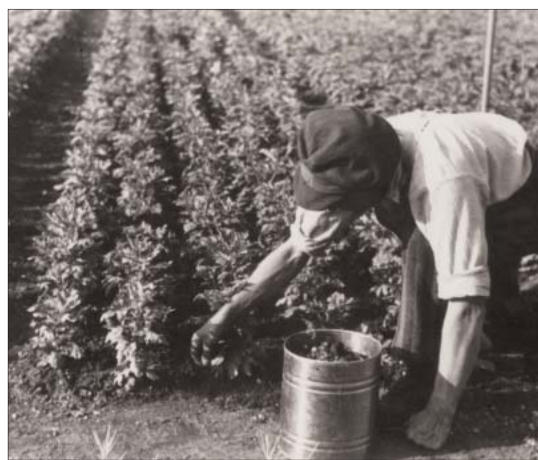
Zwangsarbeit in der Plantage / Forced labor on the plantation

1938 mussten KZ-Häftlinge hier eine große Kräutergartenanlage (Plantage) errichten. Der Anbau einheimischer Kräuter war von der »Arbeitsgemeinschaft für Heilpflanzenkunde« angeregt worden und auf besonderes Interesse beim Reichsführer SS Heinrich Himmler gestoßen. Deutschland sollte von der Einfuhr ausländischer Medikamente und Gewürze unabhängig werden. Während des Krieges wuchs die ökonomische Bedeutung der Häftlingsarbeit im Kräutergarten.