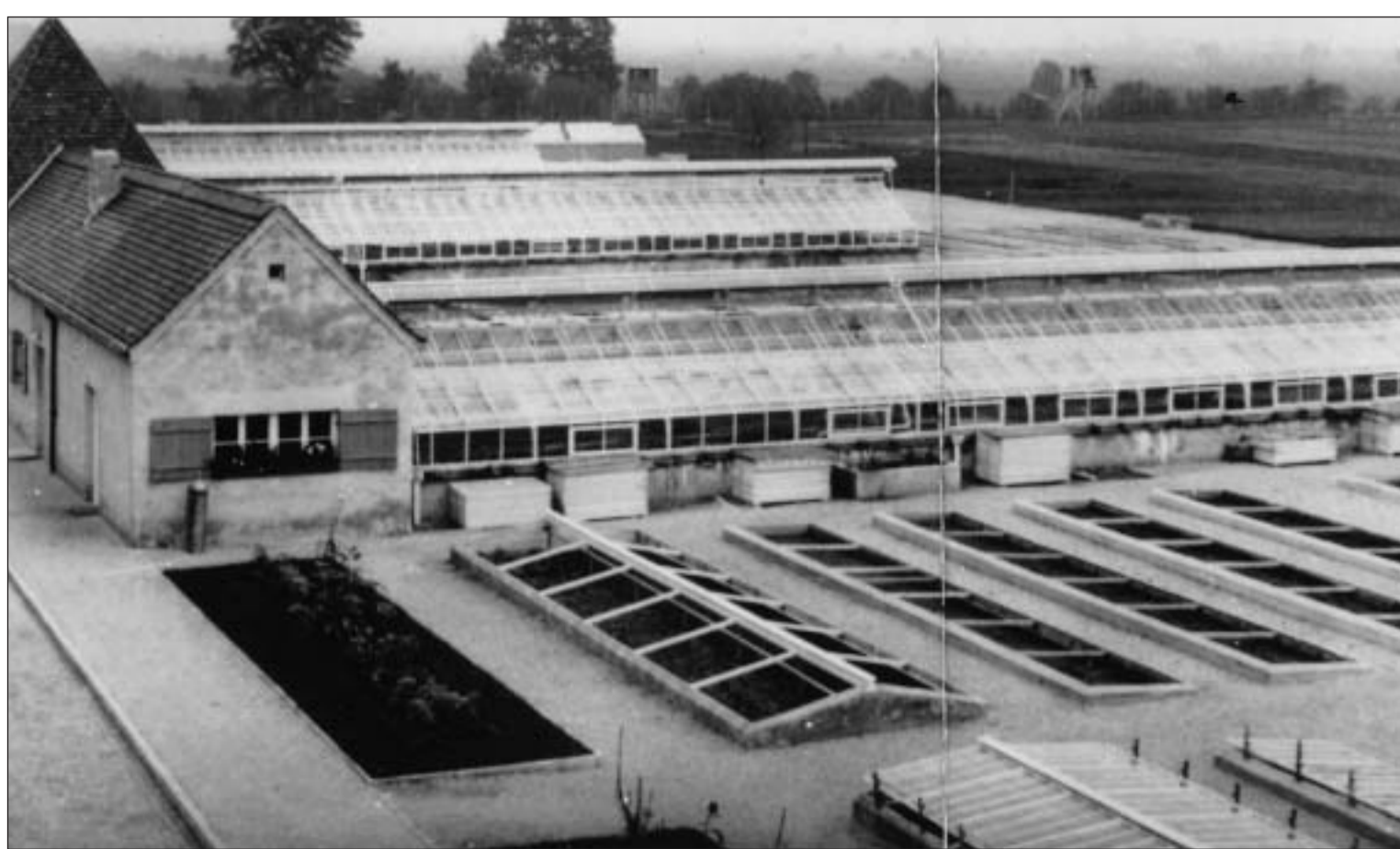
Kräutergarten des KZ Dachau / The herb garden at the Dachau concentration camp