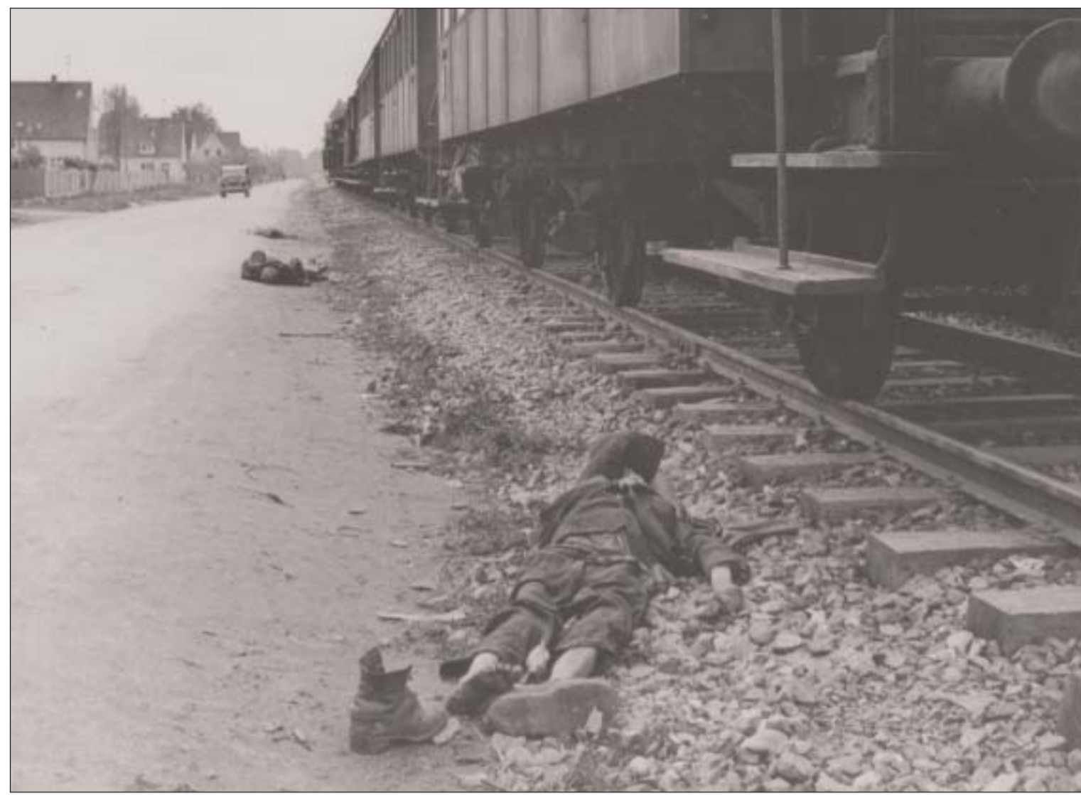
Der »Todeszug« in der Friedenstraße / The 'death train' in the Friedenstraße

Foto: Lee Miller, April/Mai 1945, Lee Miller Archives, Chiddingly