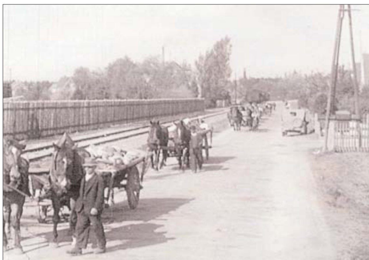
Bergung der toten Häftlinge / Recovering the dead prisoners

camp, while others were shot by the SS. A number of bodies were buried hastily on the way. As the transport came to a stop at the Dachau concentration camp, the rear cars extended from the camp grounds all the way back into the 'Friedenstraße'. Only 816 survivors could be hauled from the transport; the SS had simply left behind 2,310 dead in the cars. U.S. soldiers discovered the corpses the day after the camp's liberation. Horrified at the scale of Nazi crimes and how they could be committed in the immediate vicinity of the civilian population, US authorities forced Dachau farmers to bury the dead prisoners on the Leitenberg.