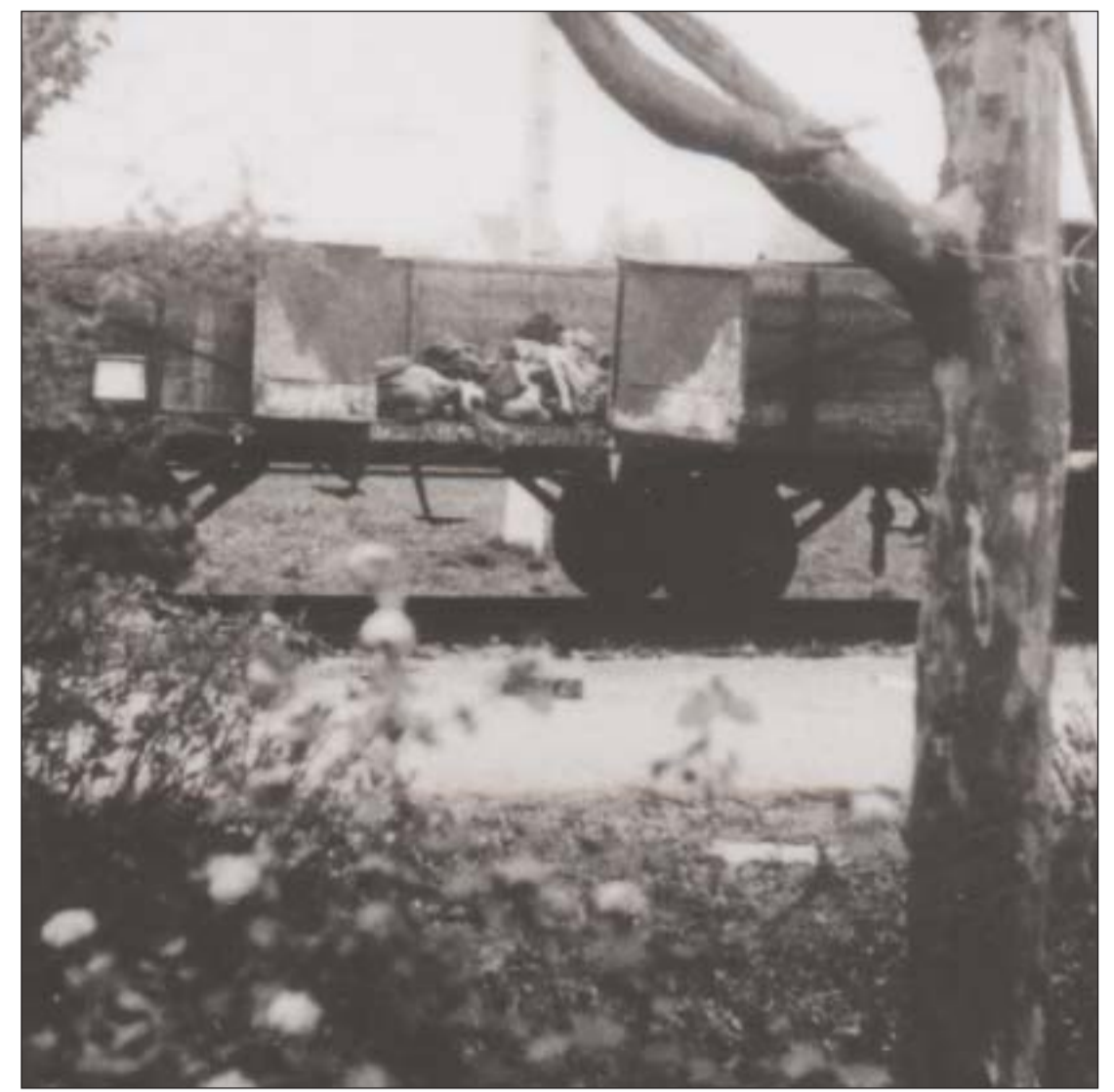
Der »Todeszug« / The 'death train'