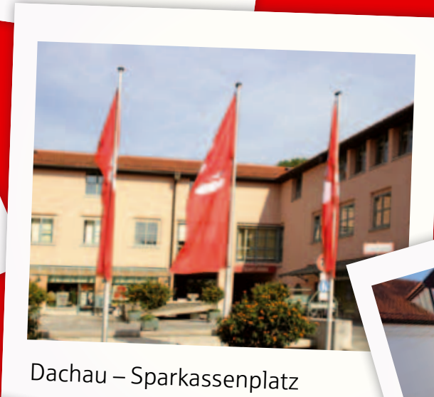
Dachau – Sparkassenplatz