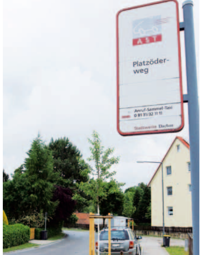
Das Anruf-Sammel-Taxi kommt zu über 100 Haltestellen – auch in die Vororte, wie hier in Mitterndorf

Das AST deckt den gesamten Stadtbereich inklusive der Außenbereiche wie Pellheim, Lohfeld oder Assenhausen ab. Und es liefert Sie nicht an einer Haltestelle ab, sondern direkt an Ihrem Fahrziel.