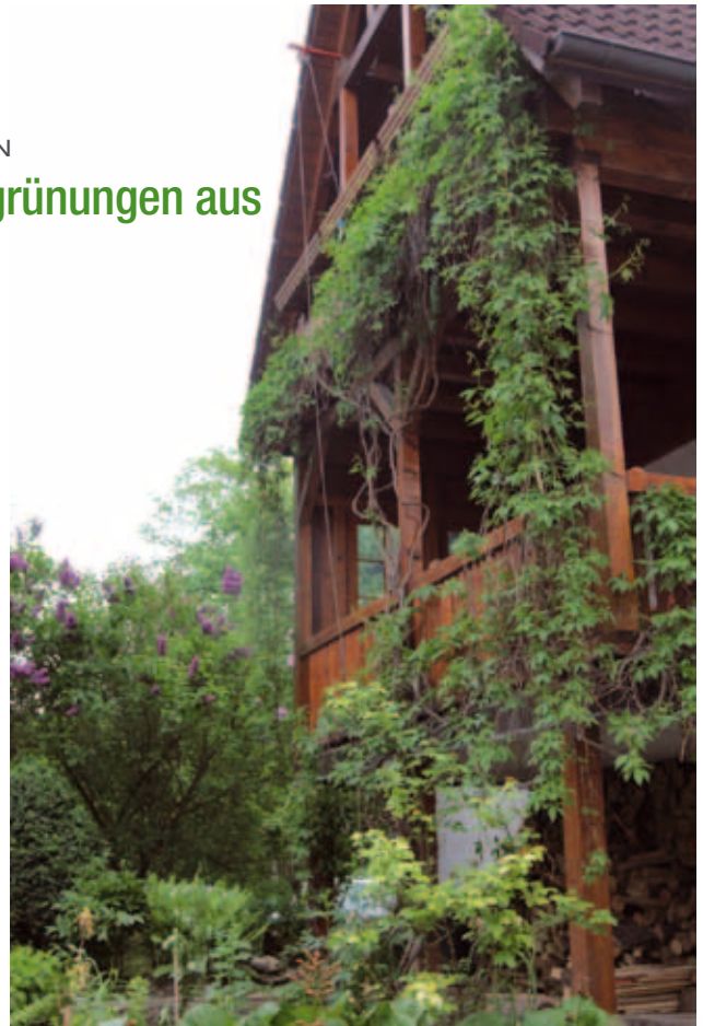
Schön anzuschauen und gut fürs Stadtklima: Kletterpflanzen, hier ein Beispiel aus Blaubeuren (Baden-Württemberg)

Mit dem Förderprogramm soll das umweltpolitische Leitbild der Stadt unterstützt werden. Dieses sieht eine Begrünung der Siedlungsflächen und die Befreiung von unnötig versiegelten Flächen vor. Die Begrünung privater Wohnanlagen und Grundstücke macht Dachau nicht nur ein Stück schöner und