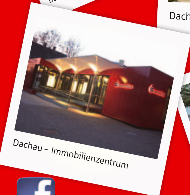
Dachau – Immobilienzentrum