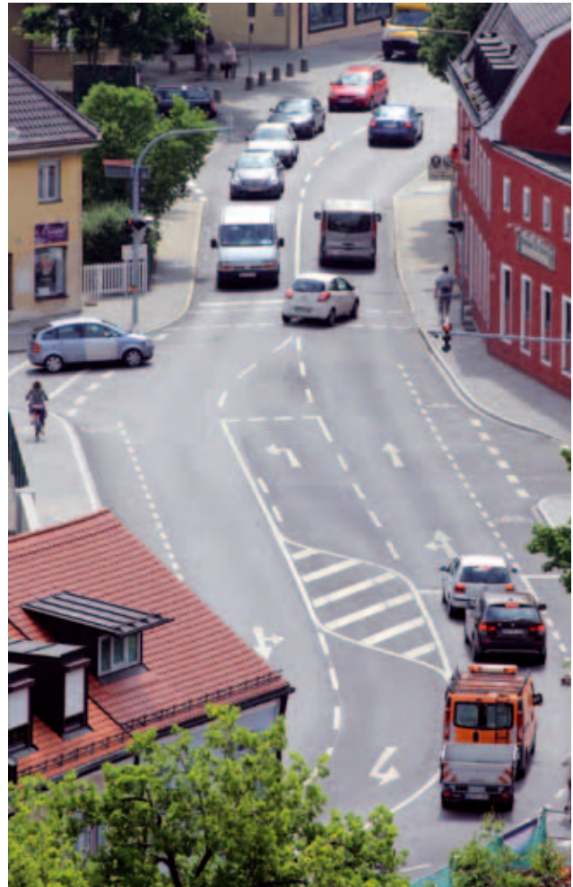
Das Ziel: Die Situation für alle Verkehrsteilnehmer verbessern. Hier die verbreiterte Amperbrücke mit neuen Abbiegespuren, Radspuren und breiteren Gehwegen.