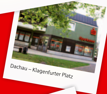
Dachau – Klagenfurter Platz