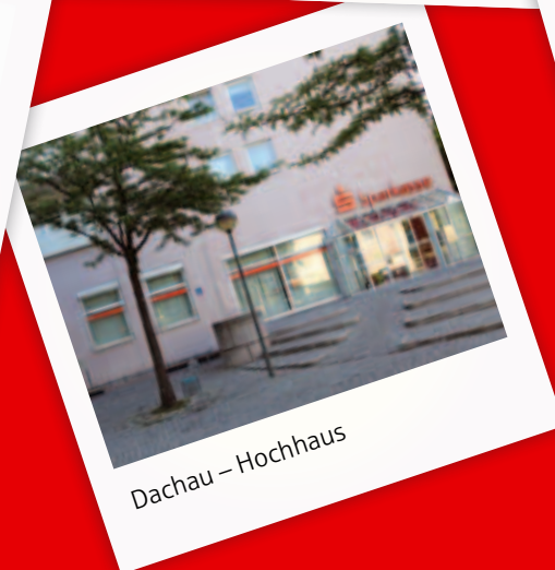
Dachau – Hochhaus