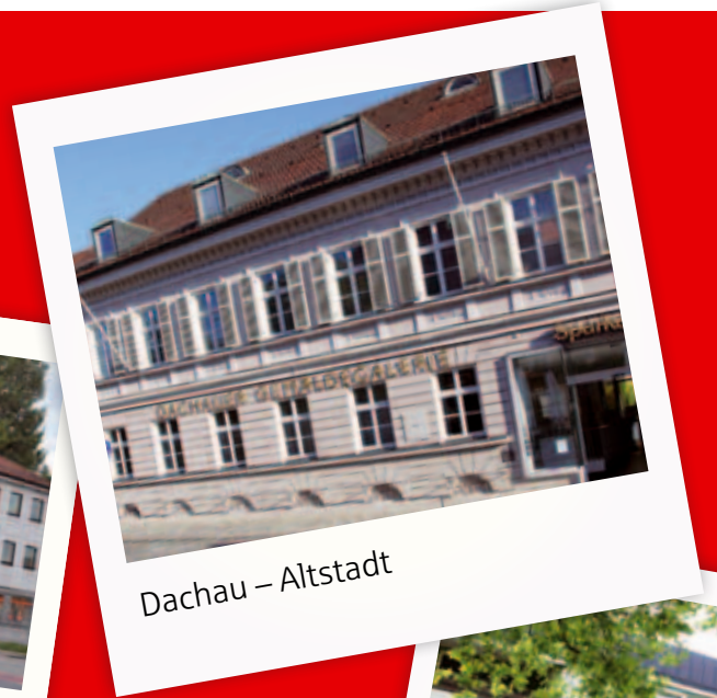
Dachau – Altstadt