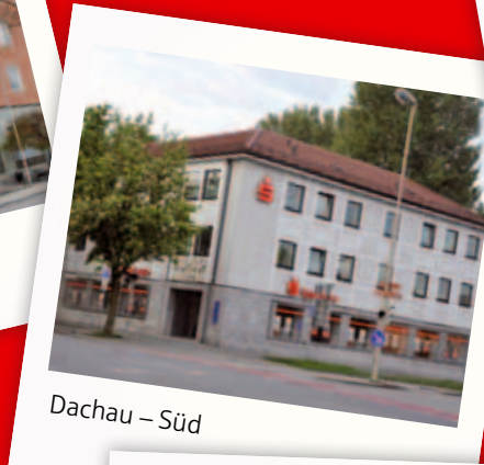
Dachau – Süd