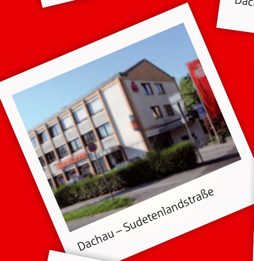
Dachau – Sudetenlandstraße