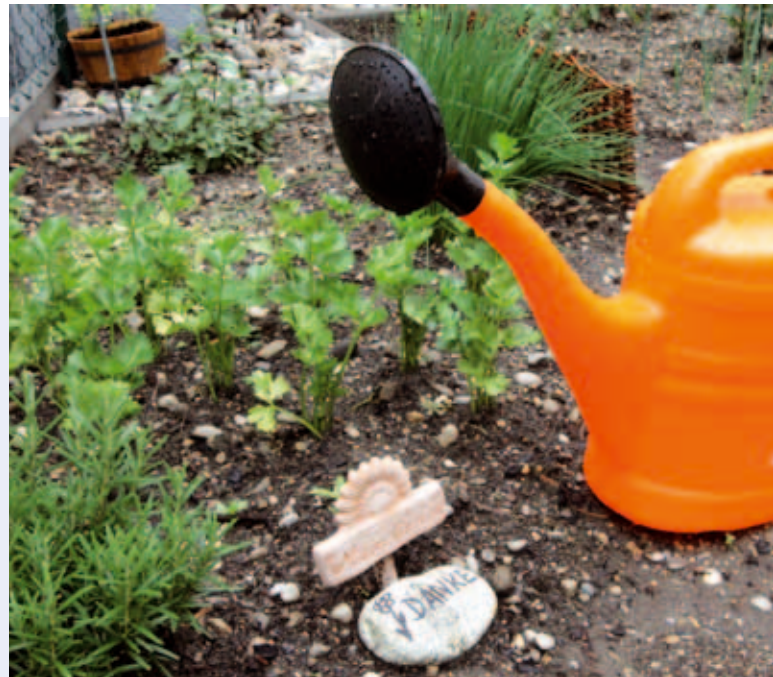
Günstiger Wohnraum: Eine der neuesten Wohnanlagen der Stadtbau steht in der Schillerstraße

Das Projekt Mietergärten ist ein Beitrag zur Steigerung der Lebensqualität für die Mieter. Zuvor lag die Rasenfläche, die sich hinter einer Einfahrt befindet und auf der gegenüberliegenden Seite von einer Hecke begrenzt wird, relativ ungenutzt brach. Jetzt kann der Hof zu einem Treffpunkt für die Mieter werden, zu einem Ort, an dem Nachbarn sich begegnen und austauschen und den sie gemeinsam gestalten.