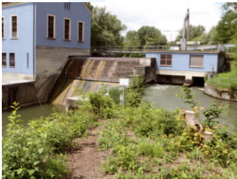
Aufstieg über 50 Becken: Am Dachauer Wasserkraftwerk bauen die Stadtwerke eine Fischtreppe

In diesen Tagen beginnen die Stadtwerke Dachau mit dem lang angekündigten Bau einer Fischaufstiegsanlage, auch