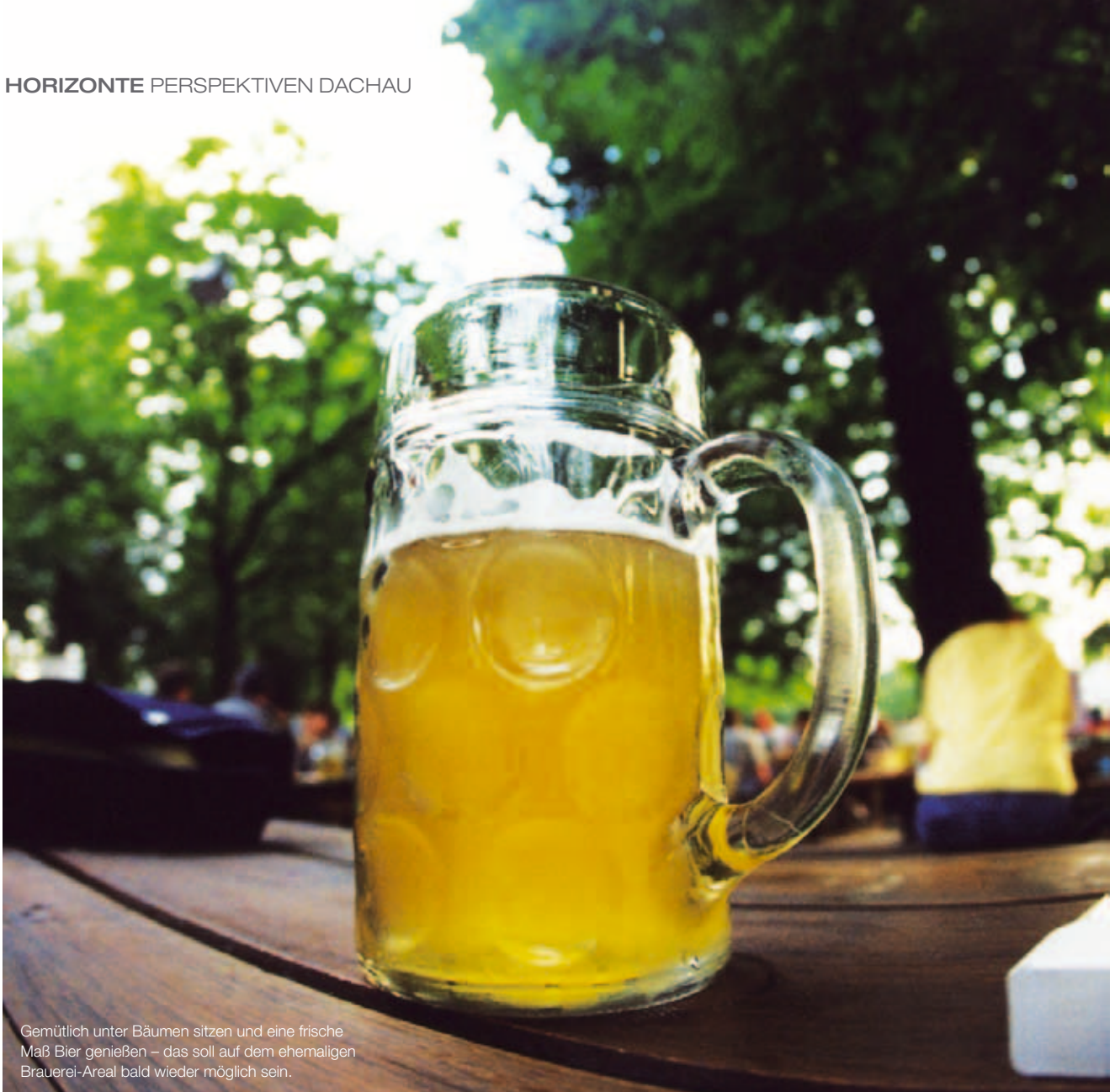
Gemütlich unter Bäumen sitzen und eine frische Maß Bier genießen – das soll auf dem ehemaligen Brauerei-Areal bald wieder möglich sein.