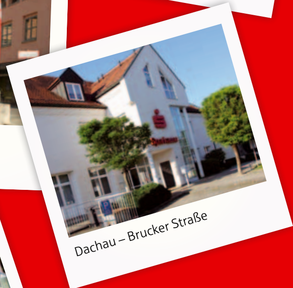
Dachau – Brucker Straße