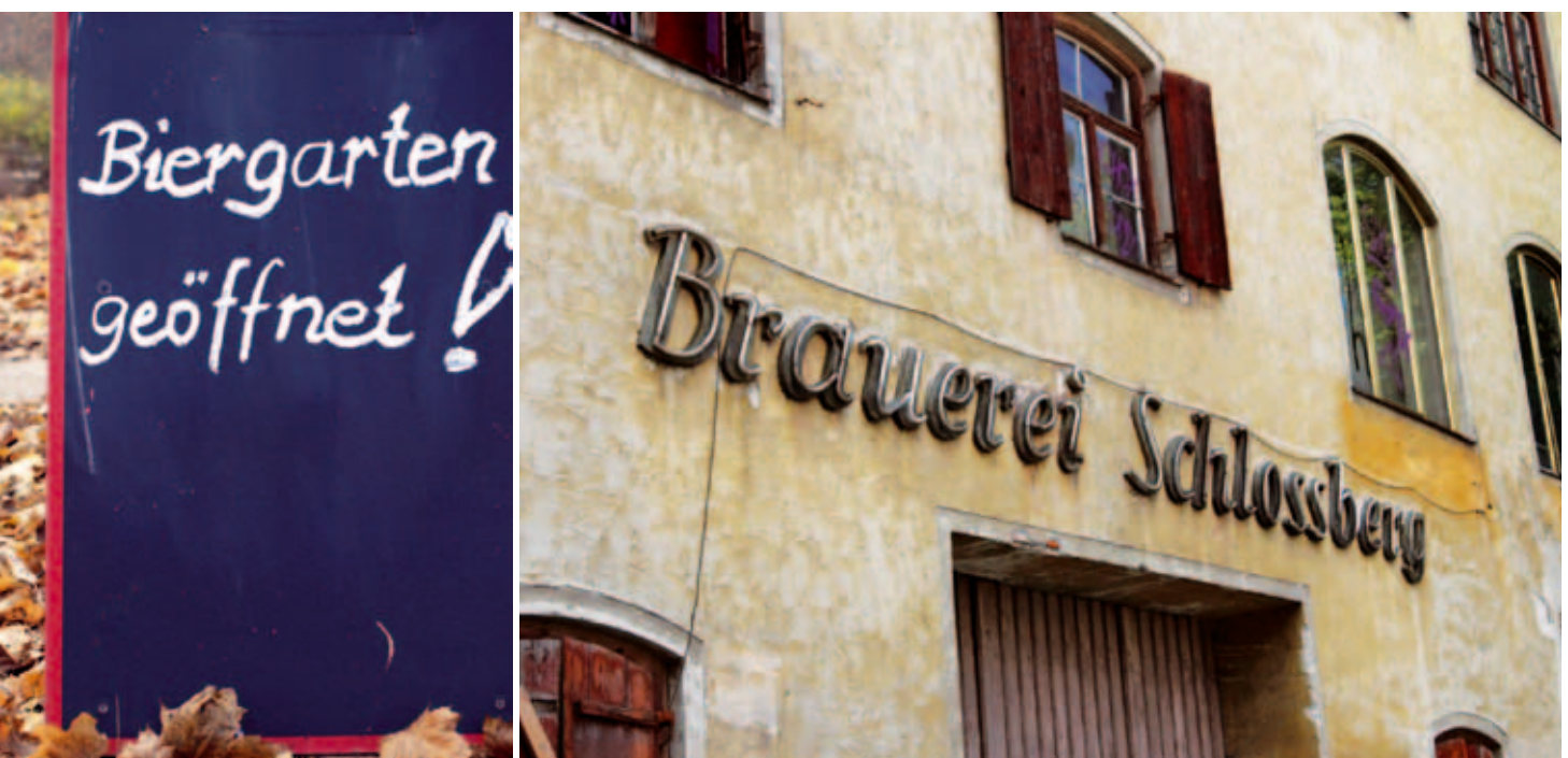
Ein Wille: Die Stadt will den Biergarten wiedereröffnen. Eine Zusage: Die Eigentümerin saniert das Brauereigebäude.

Mit der Variante eines Bürger-Biergartens kann die Stadt Dachau aktiv einen Beitrag zur Steigerung der Aufenthaltsqualität und Attraktivität der Altstadt leisten. Das Angebot der Altstadt mit seinen gastronomischen Betrieben sowie den zahlreichen Kunst- und Kulturstätten könnte mit dem Bürger-Biergarten sinnvoll erweitert werden. Zur Realisierung sind freilich noch Gespräche und Verhandlungen mit der momentanen Eigentümerin notwendig. Daher wäre es unseriös, einen konkreten Zeitplan zu nennen. Aber: Alle Zeichen stehen auf „Prost“.