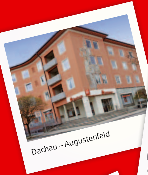
Dachau – Augustenfeld

Mit 13 Standorten allein im Stadtgebiet Dachau sind wir garantiert auch in Ihrer Nähe. Ob Vermögensanlage, Finanzierung, Versicherungen, Bausparen, Immobilien – wir haben immer das passende Angebot für Sie. Gerne vereinbaren wir auch außerhalb unserer Geschäftszeiten einen Termin mit Ihnen. Sie erreichen uns telefonisch unter 08131 73-0 oder unter www.sparkasse-dachau.de . Wenn's um Geld geht – Sparkasse.