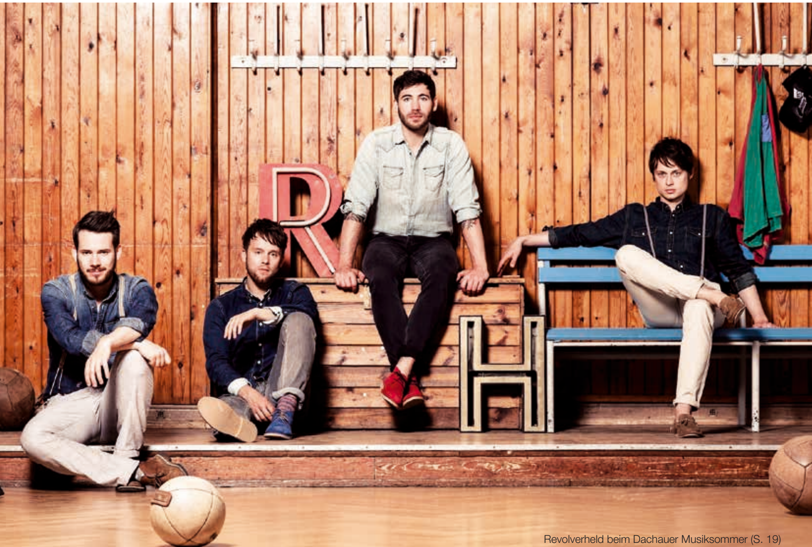
Revolverheld beim Dachauer Musiksommer (S. 19)