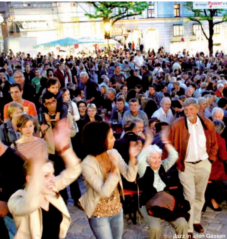
Jazz in allen Gassen