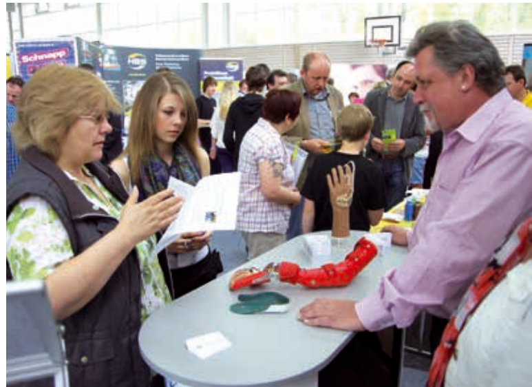
Information aus erster Hand auf der JOB 2014

Was soll ich einmal werden? Besser einen Handwerksberuf erlernen oder in die Verwaltung gehen? Erst einmal eine weiterführende Schule besuchen und dann studieren? Die Frage nach der Berufswahl gehört zu den wichtigsten, die sich junge Leute stellen müssen. Schließlich geht es dabei nicht nur um Entwicklungsmöglichkeiten und das spätere Einkommen, sondern auch um die eigene Zufriedenheit im Leben. Bei der Suche nach individuell passenden Antworten erweist sich die JOB Dachau seit Jahren für Jugendliche aller Schularten als wertvolle Hilfe. Zur JOB 2014 haben sich 55 Aussteller angemeldet, die die Fragen ihrer Besucher beantworten und Informationsmaterialien mitgeben können: Ausbildende Betriebe unterschiedlicher Größe, Handwerksinnungen, Kammern, Verbände, weiterführende Bildungseinrichtungen und