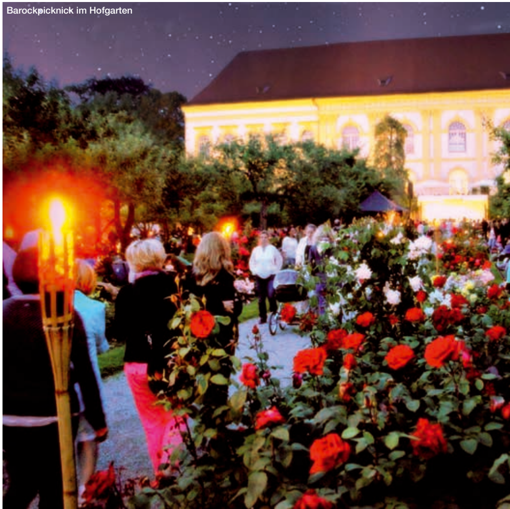
Barockpicknick im Hofgarten

Zum Auftakt ein Klassiker, zum Abschluss ein Klassiker, und dazwischen eine geballte Ladung Schweden-Pop und Deutsch-Rock. Auch heuer bietet der Dachauer Musiksommer wieder Live-Musik-Ereignisse der Extraklasse. Den Anfang macht Jazz in allen Gassen, bereits am Tag danach spielen die skandinavischen Spitzenbands Shout Out Louds und Friska Viljor auf dem Rathausplatz, im Juli folgen die deutschen Chartstürmer Revolverheld und das Barockpicknick im Hofgarten. Die Konzertveranstaltungen des Musiksommers 2014 im Überblick: