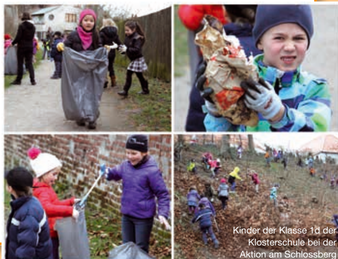
Kinder der Klasse 1d der Klosterschule bei der Aktion am Schlossberg

Eine leere Zigarettschachtel gehört nicht ins Blumenbeet. Genauso wenig wie eine Bierflasche ins Gebüsch und eine Radkappe in eine Uferböschung. Trotzdem landet solcher und anderer Unrat immer wieder dort, weil es Menschen gibt, denen der Weg zum nächsten Abfalleimer, Glascontainer oder Wertstoffhof als nicht hinnehmbare Zumutung erscheint. Was andere achtlos oder mutwillig einfach in der Umwelt entsorgen, das räumten die Teilnehmer der Aktion Saubere Stadt nun wieder weg. An dem jährlich von der Stadt organisierten frühjährlichen Ramadama nahmen auch heuer wieder zahlreiche Vereine, engagierte Privatpersonen und Schulklassen teil.