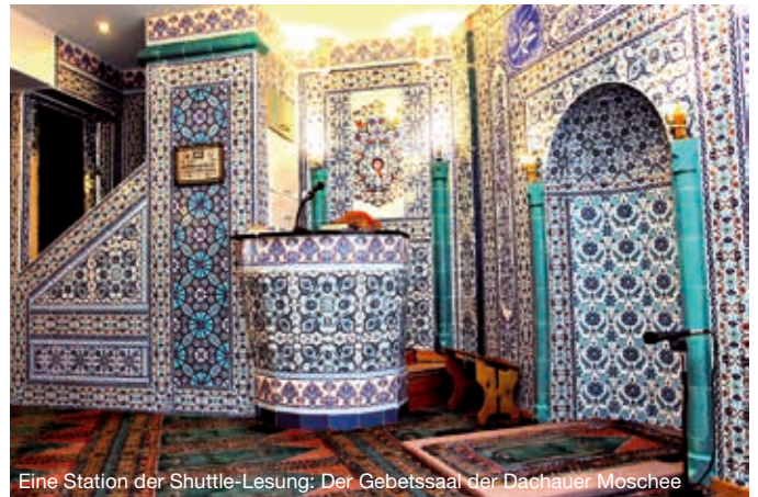
Eine Station der Shuttle-Lesung: Der Gebetsaal der Dachauer Moschee

Die Schirmherrschaft für „Dachau // Prozesse“ hat der US-Botschafter in Deutschland, John B. Emerson, übernommen. Außerdem erhält das Kreativteam um Karen Breece Fördermittel des bundesweit agierenden Fonds Darstellende Künste. Im Rahmen des Sonderprojekts „Theater im öffentlichen Raum“ des Fonds wurde „Dachau // Prozesse“ von der Jury als einziges freies Theaterprojekt in Bayern ausgewählt.